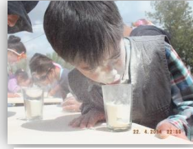
Un Üfleme Yarışması