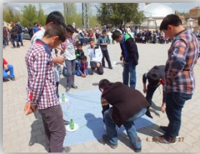
Şişeye Kalem Sokma Yarışması