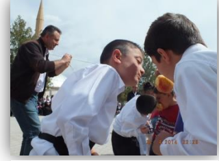
Elma Yeme Yarışması