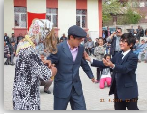
Komedî Dans Üçlüsü

Okulumuzda gerçekleştirilen 23 Nisan kutlamaları oldukça coşkulu geçti. Programda birbirinden güzel şiirler ve şarkılar okundu. Öğrencilerimiz çok sayıda yarışmada ter döktü. İşte programımızdan kareler: