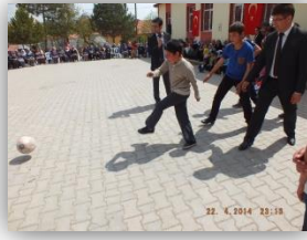
Gol Atma Yarışması