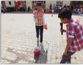
Su Taşıma Yarışması