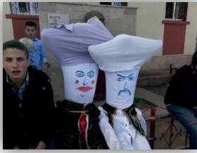
Aşuk İle Maşuk