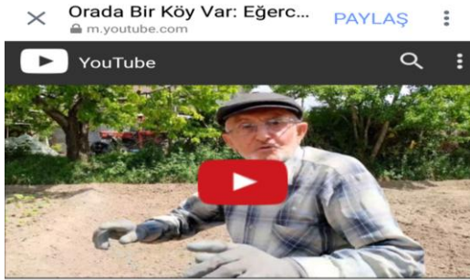
Orada Bir Köy Var: Eğerci 1.Bölüm Egerci İlkokulu-Ortaokulu · 689 görüntüleme

Eğerci ve Eğercilileri tanıtmak adına TÜBİTAK araştırma projeleri kapsamında amatör de olsa bir köy belgeseli çekmeye karar vermiştik. Belgeselimizin ilk bölümünü Youtube kanalımız üzerinden 3 Haziran'da yayınladık. Diğer bölümlerimiz ise ilerleyen günlerde izleyicilerimizle buluşacak.